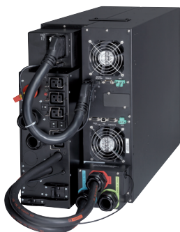
Zasilacz UPS 9PX 11 kVA z bypassem serwisowym