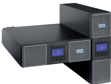
Typ obudowy: stelażowy lub wieżowy